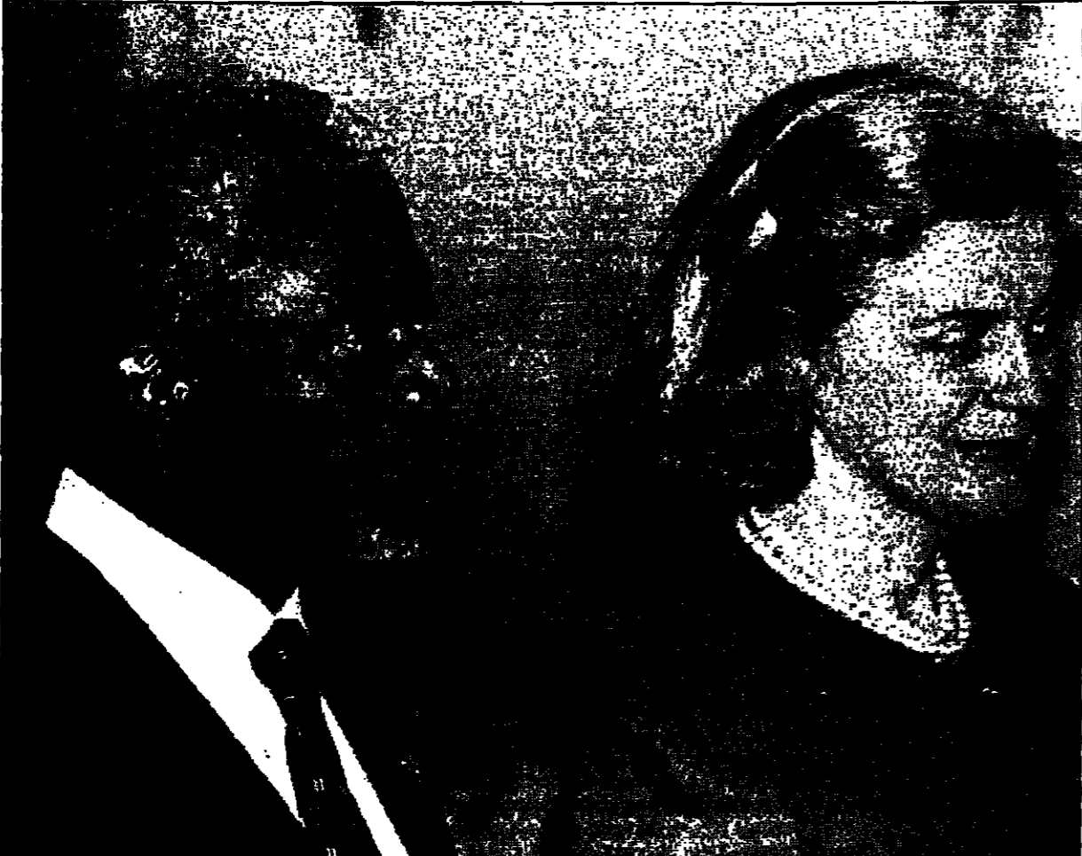
كوفي انان وزوجته آنا خلال زيارتهما المتعددة للبارود في تونس قبيل توجهه الى ليبيا جوا

واي دبلوماسيون ان الامم المتحدة وليبيا القذافي على ما يبدو ليس الخبيرين من التوصل الى اتفاق حول قضية لوكربي يمكن للامم المتحدة ان تلعب دورا كبيرا في التوصل الى اتفاق حول قضية لوكربي. وقال كوفي انان في بيان له عقب اجتماعه مع القذافي في تونس امس ان الامم المتحدة ستواصل العمل على التوصل الى اتفاق حول قضية لوكربي. وقال انان ان الامم المتحدة ستواصل العمل على التوصل الى اتفاق حول قضية لوكربي.